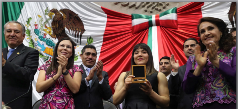
Entrega de la medalla.

ALEXA CITLALI MORENO MEDINA, gimnasta olímpica mexicana. Nació el 8 de agosto de 1994 en Mexicali, Baja California, fue medallista de bronce en salto de caballo en el Mundial de Gimnasia Artística de 2018, siendo la primera mexicana en lograr un podio en dicho certamen.