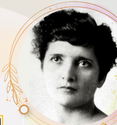
ELVIA CARRILLO PUERTO Nació el 6 de diciembre de 1878, Motul, Yucatán y murió el 15 de abril de 1968 Ciudad de México