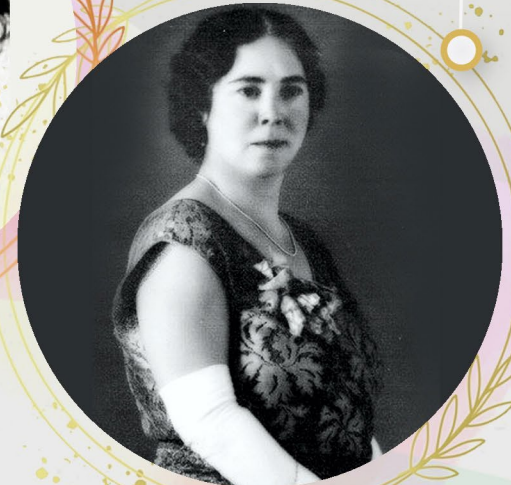
HERMILA GALINDO ACOSTA Nació el 2 de junio de 1886, en Lerdo, Durango y murió el 19 de agosto de 1954